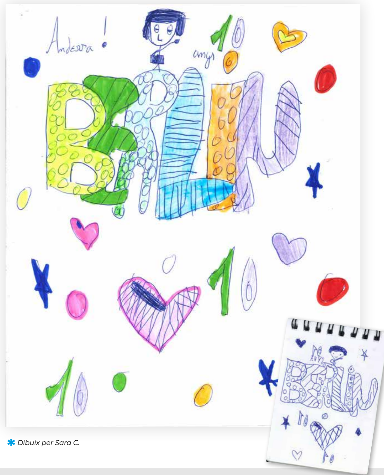
* Dibuix per Sara C.

Envia'ns els teus textos, poemes, dibuixos o qualsevol altra creació, i els publicarem en un dels propers números de La Faixa .